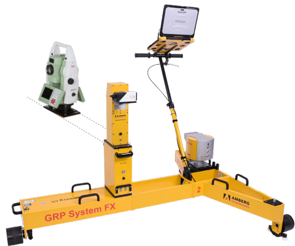
Vorne: Amberg IMS 3000 mit Profiler 120 FX Hinten: Tachymeter für Amberg IMS 1000