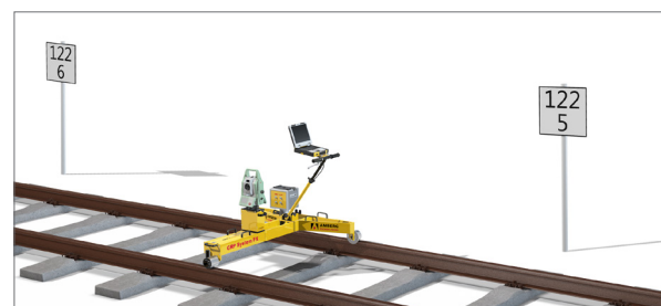
Relative Gleisgeometrievermessung mit Amberg IMS 1000